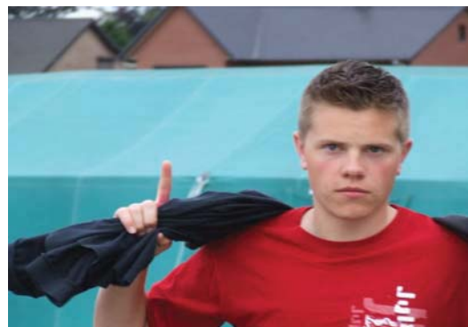
De man ziet er als volgt uit