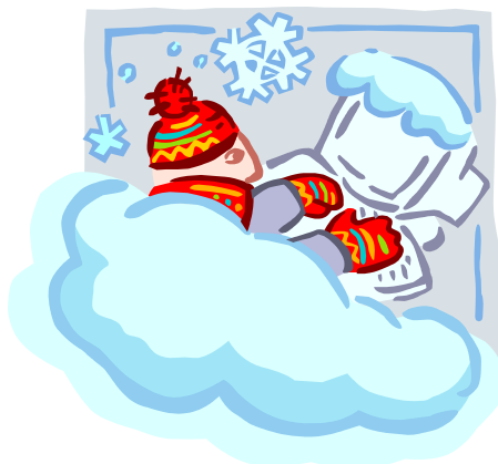
Bijschrift bij afbeelding.

Als er nog ruimte over is, kunt u een afbeelding invoegen.