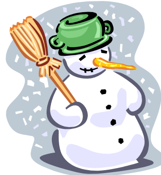
Bijschrift bij afbeelding.

Publisher kunt u op eenvoudige wijze de nieuwsbrief converteren naar een website. Deze kunt u vervolgens op het World Wide Web publiceren.